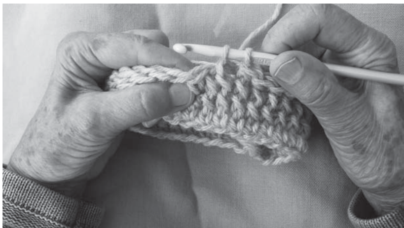
Billede 2 Slå om garnet og træk nu en maske op så lang at nålen holdes vandret, slå om og træk den gennem 2 m. Sæt nålen under næste m og træk en ny m op, slå om og træk gennem 2 m.