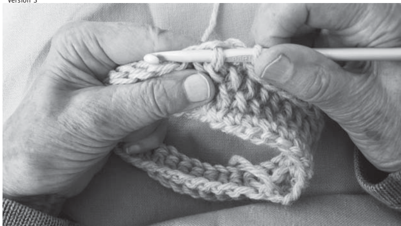
Billede 1 Sæt nålen vandret under masken.